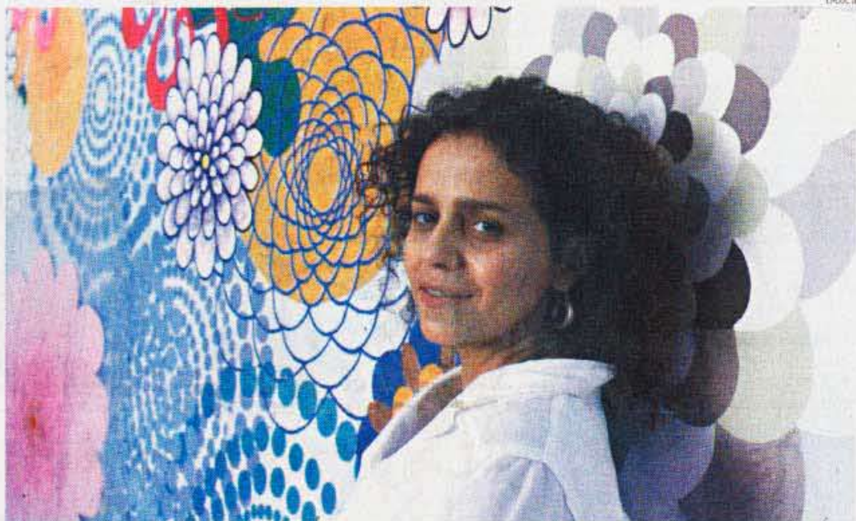
Bem cotada no mercado externo, a artista teve a tela "O Mágico", arrematada em leilão Sothebys de Nova York por US$ 1 milhão

Os experimentos visuais de Beatriz Milhazes se aprimoraram a partir da virada do século, com uma linguagem mais depurada e com um ganho de segurança — o tempo a fez perder seus pudores. Ela não teve receio em assumir o fazimento da pintura decorativa como seu leitmotiv . O tempo a levou a abraçar um repertório de fácil assimilação visual, com uma paleta de combinações nada ousada e com certo conforto aos espíritos menos afoitos. Assim como há gente que não gosta de improvisos ou de surpresas, preferindo o papai e mamãe das imagens, há quem não consiga conviver com o que não seja consagrado, tal qual a idéia de que um dia vem depois do outro ou de que após o