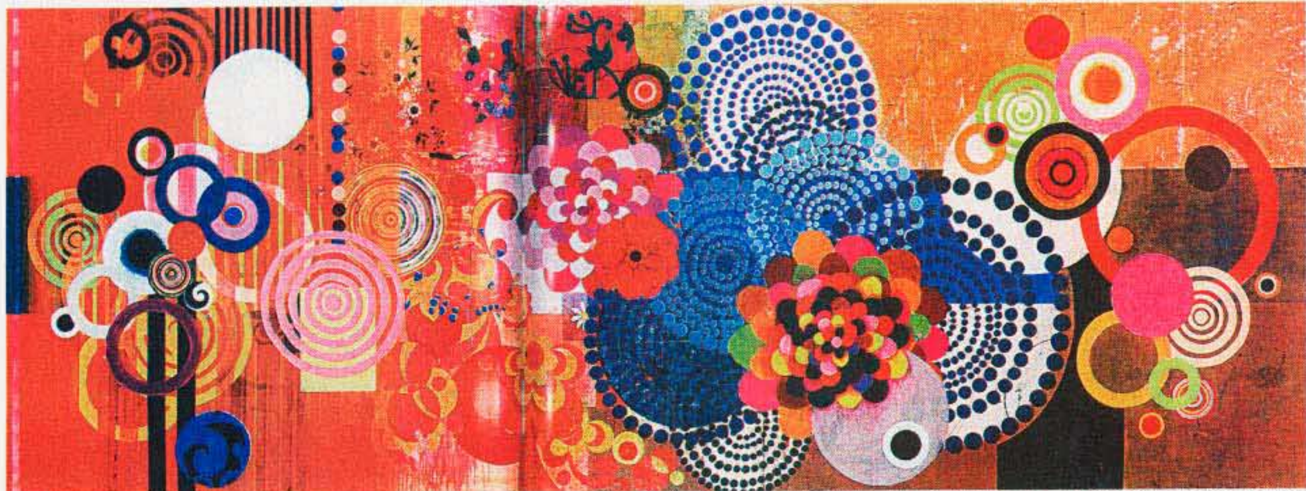
A mostra da artista, a primeira depois de bater recorde de preço no ano passado, traz cerca de 30 obras, produzidas entre 1989 e 2007, número significativo para quem produz 10 telas por ano em média.